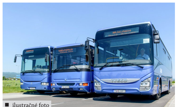
■ ilustračné foto

Viac informácií na www.sadtn.sk a www.sadpd.sk .