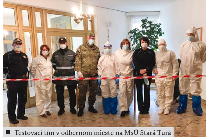
Testovací tím v odbernom mieste na MsÚ Stará Turá

Na záver je nutné dodať úprimné poďakovanie pre všetkých, ktorí sa aktívne zapojili do testovania na COVID-19 (koronavírus) v Starej Turej. Najväčšie poďakovanie však patrí už v úvode spomínaným pracovníkom, vďaka ktorým sa testovanie mohlo uskutočniť, ale aj mnohých ďalším, ktorí zabezpečovali pokojný priebeh testovania v Starej Turej