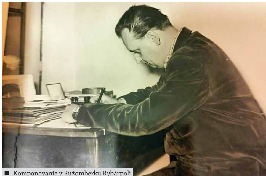
■ Komponovanie v Ružomberku Rybárpoli

Doma som si pri klavíri vymýšľala a zapisovala rôzne jednoduché melódie. Vytešená som mu podala svoj výtvar čakajúc, že si to zabrnká a pochváli ma. On si to len pri katedre vážny pozrel, nič si neprehral a pochválil ma. Cítila som sa ukrivdená mysliac si, že nemôže vedieť, aká to bola melódia. Až po rokoch som zistila, že existuje absolútny sluch. A ten náš milovaný súdruh učiteľ mal. ▶