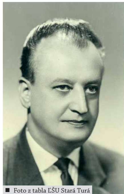
■ Foto z tabla LŠU Stará Turá

Učil ma hudobnú teóriu. Na jeho hodiny sme sa tešili. Triedu sme mali v Domove bielych hláv na najvyššom poschodí. Na prízemí