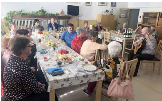
◀ foto k článku mesiac jesene i mesiac úcty k starším