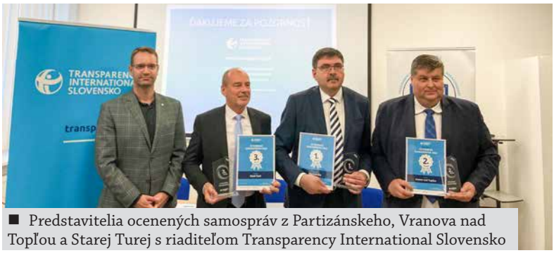
■ Predstavitelia ocenených samospráv z Partizánskeho, Vranova nad Topľou a Starej Turej s riaditeľom Transparency International Slovensko

„Patriť medzi top lídrov sa nám podarilo vďaka vysokému ohodnoteniu vo všetkých 109 hodnotených kritériách z 11 oblastí (napr. predaj a prenájom majetku, hospodárenie, etika, konflikt záujmov, prístup verejnosti k informáciám, podiel verejnosti na rozhodovaní v samospráve, verejné obstarávanie, oblasť rozpočtu a zmlúv a pod.). Keďže sme koncom minulého roka získali aj cenu ZLATÝ ERB za rok 2021 pre absolútny víťaza za najlepšie webové sídlo medzi samosprávami na Slovensku, je pre nás toto ďalšie prestížne ocenenie veľkou satisfakciou a potvrdením, že