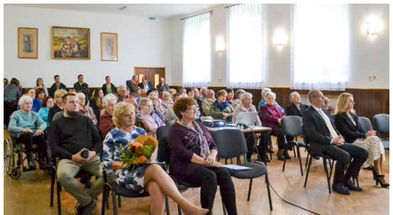
▲ foto k článku 170. výročie prvej kopaničiarskej evanjelickej školy ...