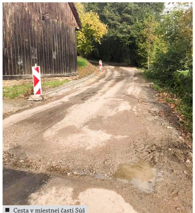
■ Cesta v miestnej časti Súš