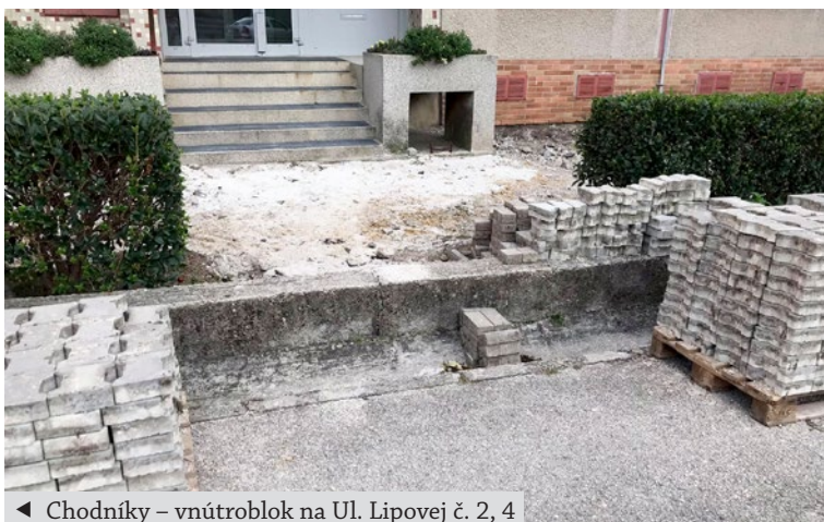
◀ Chodníky – vnútroblok na Ul. Lipovej č. 2, 4