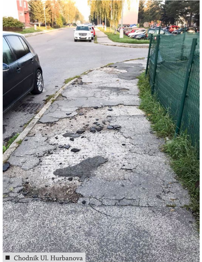
■ Chodník Ul. Hurbanova