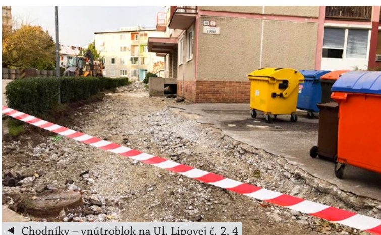
◀ Chodníky – vnútroblok na Ul. Lipovej č. 2, 4