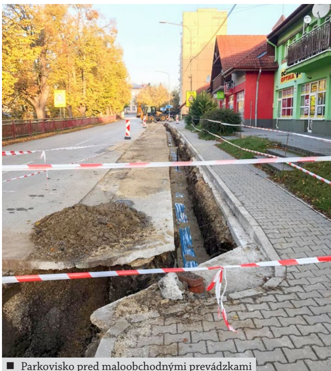
■ Parkovisko pred maloobchodnými prevádzkami

Celková vysúťažaná suma za realizáciu prác je 181 031,60 €. Ukončenie prác na chodníkoch a komunikáciách je závislé od vhodných poveternostných podmienok, preto veríme, že počasie bude realizátorovi priat.