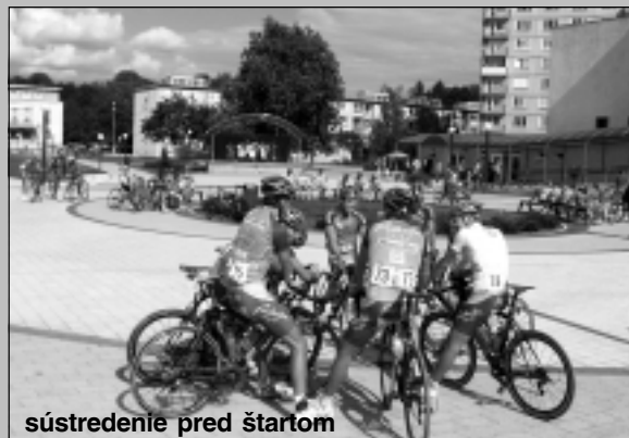
sústredenie pred štartom