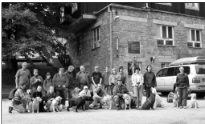
Časť účastníkov na výlete na Holubyho chatu

Popularita a obľúbenosť tohto podujatia rastie, pretože mladí majitelia psíkov majú možnosť oboznámiť sa s pravidlami výcviku, psi sa v kolektíve vzájomne spoznávajú a lepšie sa učia. Starší a skúsení chovatelia si môžu vymeniť skúsenosti a tieto konzultovať s veterinármi, predstaviteľmi chovateľských staníc a zástupcami firiem špecializujúcich sa na produkty súvisiace s chovom retrieverov. Pobyt v krásnom prostredí a stretnutia so zaujímavými ľuďmi vytvárajú podmienky na vznik nových priateľstiev, na ktoré sa tak ľahko nezabúda. Ľudia prichádzajú a sú šťastní. Psi prichádzajú a sú