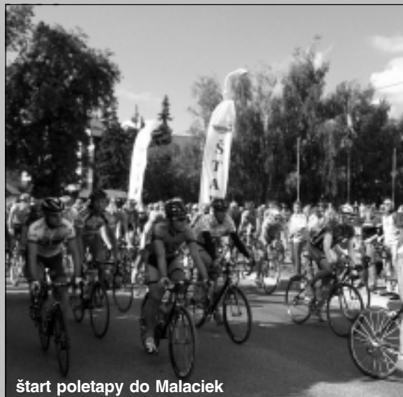
štart poletapy do Malaciek

Peletón týchto medzinárodných cyklistických pretekov sa vrátil do nášho mesta po piatykrát, naposledy - 8 až 10. augusta 1989- bola Stará Turá etapovým centrom ich 33. ročníka počas troch etáp. Možno bol medzi organizátormi či technickým personálom v sprievodných vozidlách na tohtoročnom 52. ročníku aspoň jeden účastník vtedajšieho podujatia. Pestrý peletón pretekárov upútal a zaujal nielen priateľov cyklistiky, ale aj nemálo obyvateľov nášho mesta, ktorí vytvorili tomuto podujatiu v centre mesta Stará Turá nádhernú kulisu.