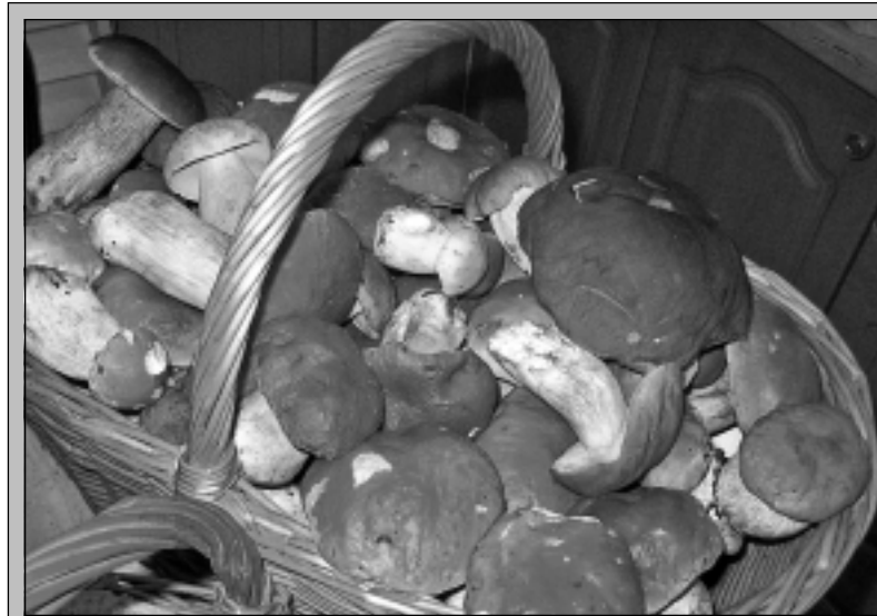
Aj tohtoročná hribarská sezóna bola štedrá...