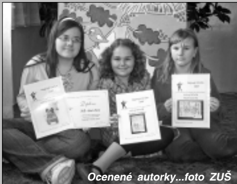
Ocenené autorky...