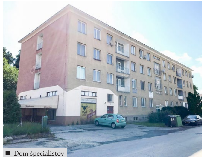
■ Dom špecialistov

Obe budovy sú súčasťou komplexnej obnovy areálu bývalej priemyslovky, nazvanej zóna „Za gátom“. Mestská zóna „Za gátom“ vznikla v päťdesiatych rokoch minulého storočia v rámci regulačného plánu obce, neskôr tu vzniklo sídlisko s necelou tisícovou bytov. Viaceré objekty bývalej Strednej priemyselnej školy elektrotechnickej, administratívne priestory mestskej spoločnosti Technotur a bývalý Dom špecialistov sú v zlom technickom stave, škola a jej areál sú už roky