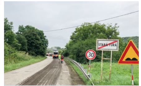
■ rekonštrukcia úseku cesty III. triedy Stará Turá – Vaďovce