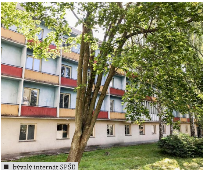
■ bývalý internát SPŠE

Za posledných 10 rokov prišla Stará Turá o takmer 900 obyvateľov. Jednou z priorit mesta je preto poskytnúť ľuďom dostatočné ubytovacie možnosti.