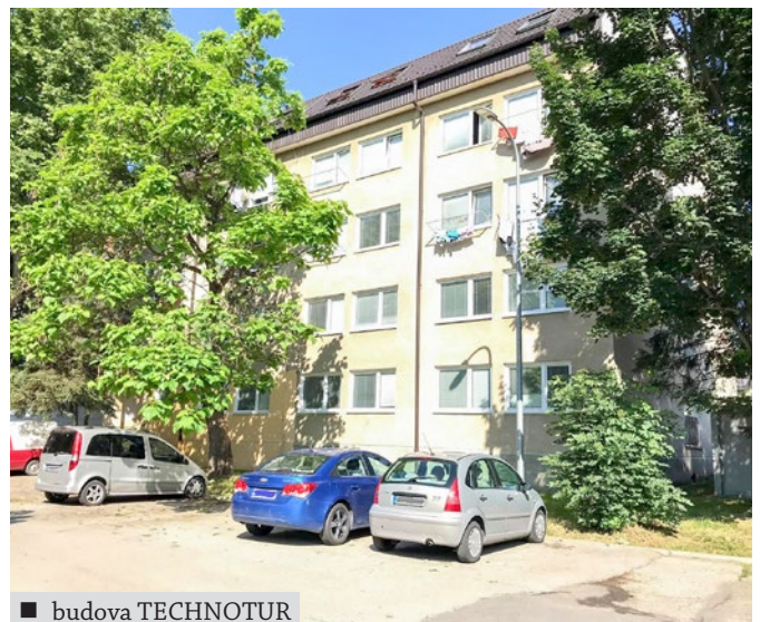
■ budova TECHNOTUR