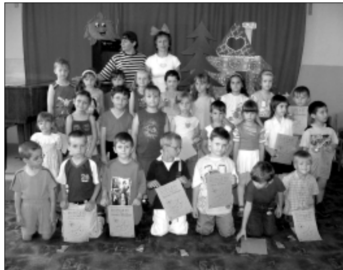
Radosť z ocenenia

Záver roka sme ukončili olympiádou ku Dňu detí. MŠ pod salašom ju spojila i s opekačkou s rodičmi na Dubníku, čím sa snažila zomknúť rodinu ako celok. Nám v MŠ za cuk-