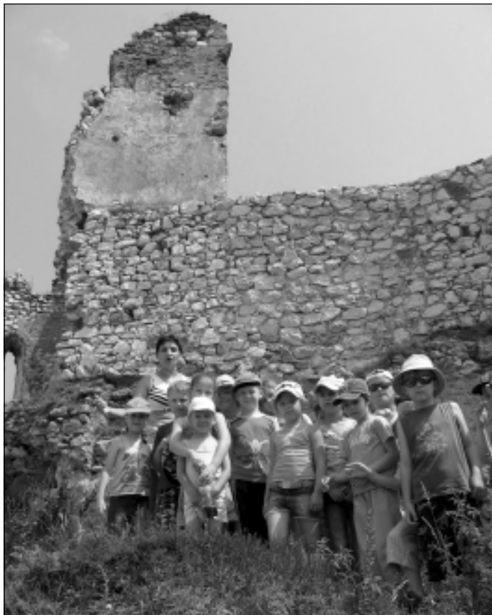
Výlet na Čachtický hrad bol krásnym zážitkom...

prírody. Najprv sme spoznávali blízke okolie Starej Turej polďovými výletmi. Neskôr sme si objednali autobus a vybrali sme sa na vrh Roh. Pripomenuli sme si minulosť, poobzerali okolie, zasúťažili a na záver sme navštívili sušičku ovo-