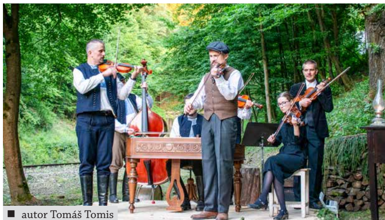
■ autor Tomáš Tomis