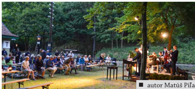
■ autor Matúš Piľa