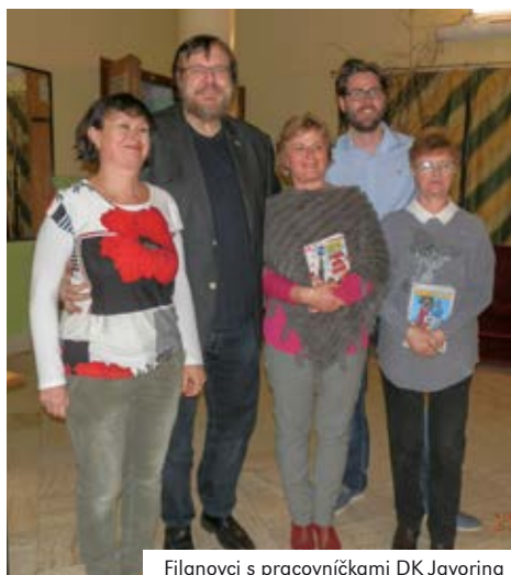
Filanovci s pracovníčkami DK Javorina

Ste spisovateľ, textár, dramaturg, scenárista, moderátor, cestovateľ. Z tohto čomu sa najviac venujete? A čomu najradšej?