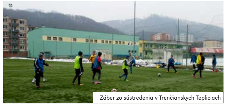
Záber zo sústredenia v Trenčianskych Tepliciach

na umelej trávě na Myjave s mužstvom FK Stará Myjava, ktorý sme tiež prehrali 2:1. Zápas to bol však vyrovnaný, kombinačne sme boli lepší ako náš súper, dopúšťali sme sa však hrubých chýb, ktoré náš súper dvakrát potrestal. Tretí zápas sme odohrali s najlepším súperom, účastníkom IV. ligy FK Vrbové. Zápas sa opäť hral na umelej trávě v Novom Meste nad Váhom, mal výbornú úroveň a skončil sa remízou 2:2. Hodnotím to ako vyrovnaný zápas, dokonca v niektorých fázach zápasu som mal pocit, že sme boli lepší ako súper. Posledný prípravný zápas sme hrali s FK Kočovce a vyhrali sme ho presvedčivo 9:4. V tomto zápase sme jasne prevýšili súpera vo všetkých herných činnostiach, keď už v 10. min. bolo o víťazovi rozhodnuté, pretože sme vyhrávali 3:0. Následne však bolo ťažké udržať koncentráciu hráčov a preto sme súperovi dovolili strelit až štyri góly. Ak by som mal zhodnotiť prípravné zápasy, tak naša výkonnosť mala zvyšujúcu tendenciu. Naším cieľom v jarnej časti súťaže je záchrana v 5. lige. Bude to ale veľmi náročné, pretože súťaž je veľmi vyrovnaná a ani o prekvapenia nebýva núdza. Ak chceme byť konkurenčne schopní, musíme každý zápas hrať v kompletnej zostave, byť stopercentne pripravení a potrebujeme aj povestný kúsok športového šťastia.“