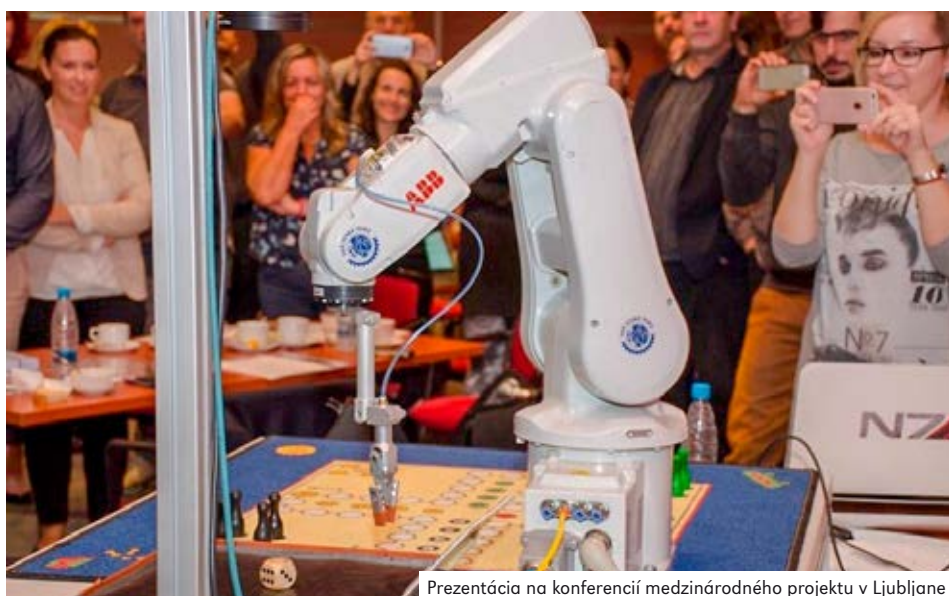
Prezentácia na konferencii medzinárodného projektu v Ljubljane