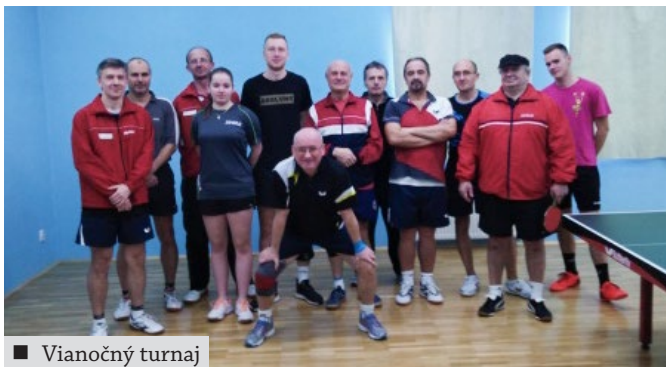
■ Vianočný turnaj

Dňa 27.12.2019 sa v stolnotenisovej herni uskutočnil ďalší ročník tradičného Vianočného turnaja. Zúčastnilo sa ho 13 hráčov klubu, ktorí najskôr začali súboje v dvoch štvorčlenných a jednej päťčlennej