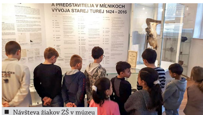
■ Návšteva žiakov ZŠ v múzeu