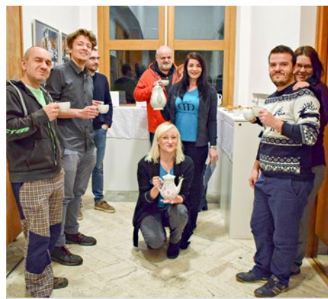
■ Filmový festival Jeden svet v Starej Turej

žiaci zo základných a stredných škôl, ktorí v múzeu spoznávajú históriu nášho mesta. Okrem prehliadok stálej expozície školám ponúkame aj iné vzdelávacie aktivity: prezentácie s videoukážkami na rôzne témy (Mesto Stará Turá,