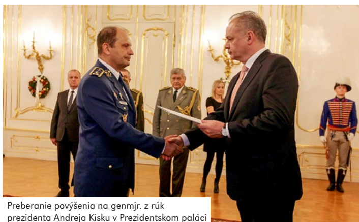
Preberanie povýšenia na genmjr. z rúk prezidenta Andreja Kisku v Prezidentskom paláci