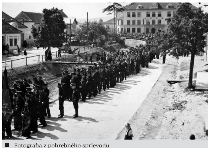
■ Fotografia z pohrebného sprievodu