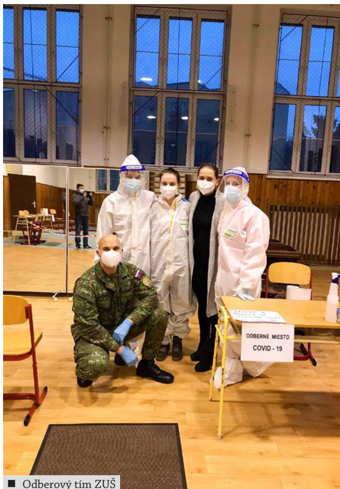
■ Odberový tím ZUŠ