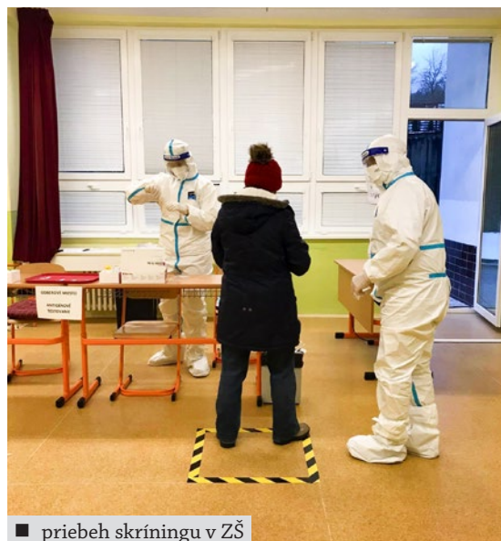
■ priebeh skrínungu v ZŠ