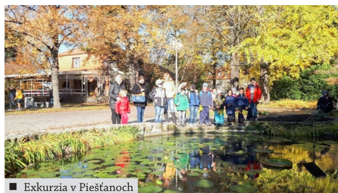
■ Exkurzia v Piešťanoch