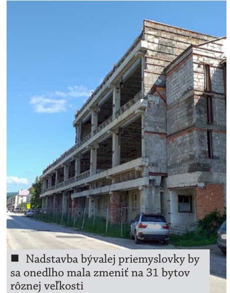
■ Nadstavba bývalej priemyslovky by sa onedlho mala zmeniť na 31 bytov rôznej veľkosti

Náš cieľavedomý prístup sa ale pri riešení tejto najohyzdnejšej budovy v Starej Turej, t.j. nadstavby bývalej priemyslovky na ulici gen. M. R. Štefánika, vypláca a prináša svoje ovocie. Po mnohých pokusoch, scenároch a snahách vidíme svetlo na konci tunela. Na základe verejnej obchodnej súťaže, ktorú mesto vypísalo, si v najbližších dňoch prevzme stavenisko jej víťaz. Práve tento objekt, ktorý chátral viac ako 30 rokov, je v súlade s regulatívnymi územného plánu predmetom projektu bytového domu a plynulo uzatvorí nový vzhľad a určenie tejto časti mesta. Zámerom investora je vybudovať objekt v modernej architektúre, kde v priebehu 16 mesiacov vybuduje 31 bytov rôznej veľkosti. Noví vlastníci budú mať možnosť spojiť dobrú adresu s ľahkou dostupnosťou, parkovaním a bývaním v presvetlených bytových priestoroch s mezonetom. Samozrejmosťou bude možnosť využitia výťahu priamo z parkoviska, ktoré bude situované v priestore, kde v súčasnosti stoja bývalé dielne. Samotné bytové jednotky budú situované na druhom a treťom