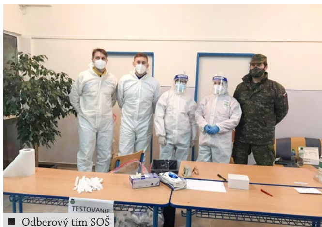
■ Odberový tím SOŠ