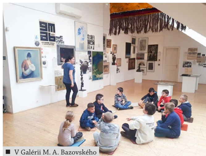
■ V Galérii M. A. Bazovského