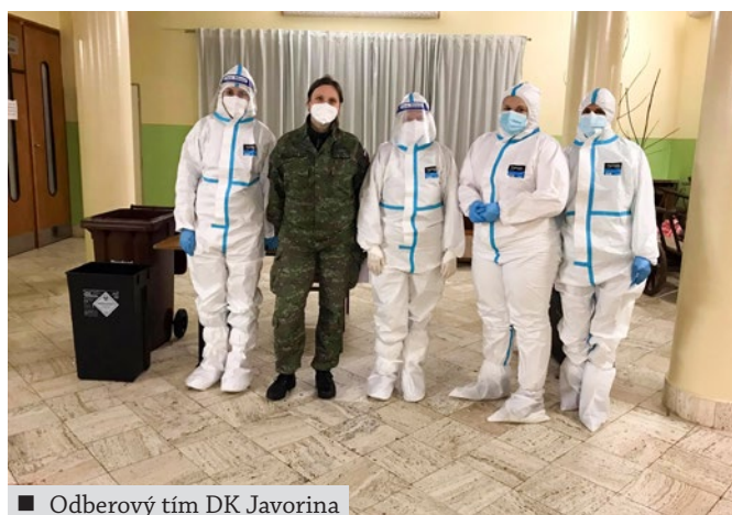
■ Odberový tím DK Javorina