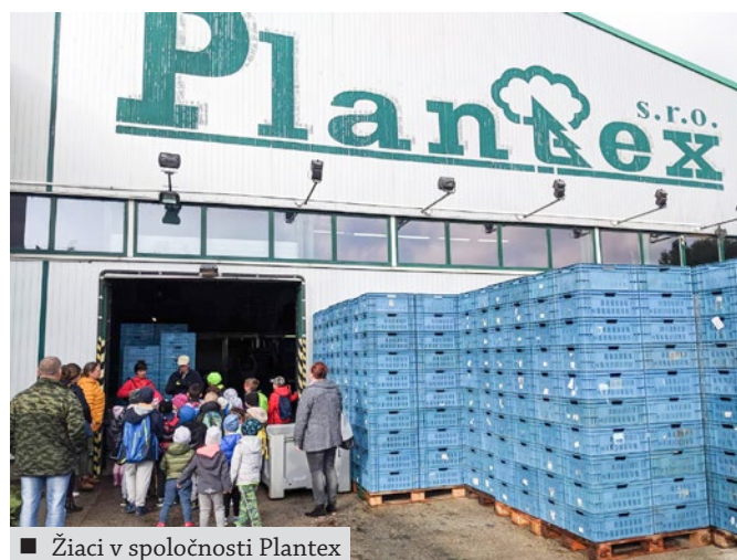
■ Žiaci v spoločnosti Plantex