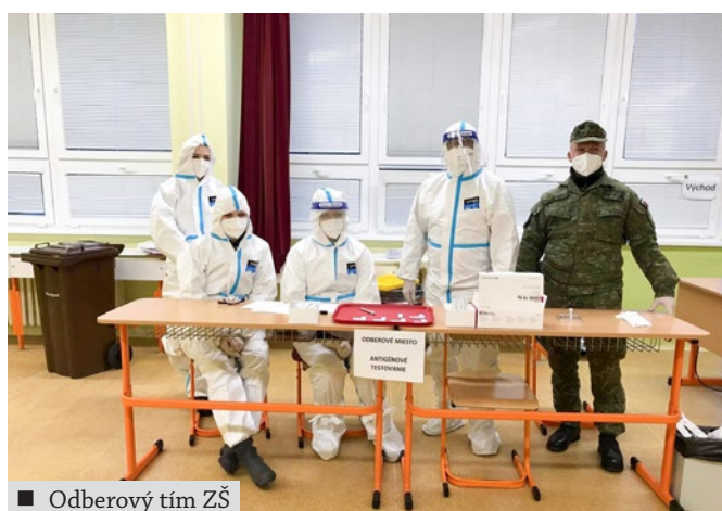
■ Odberový tím ZŠ