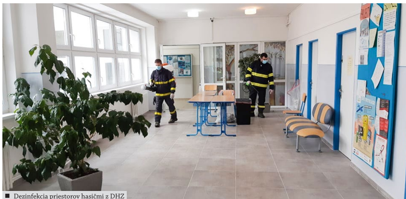
■ Dezinfekcia priestorov hasičmi z DHZ