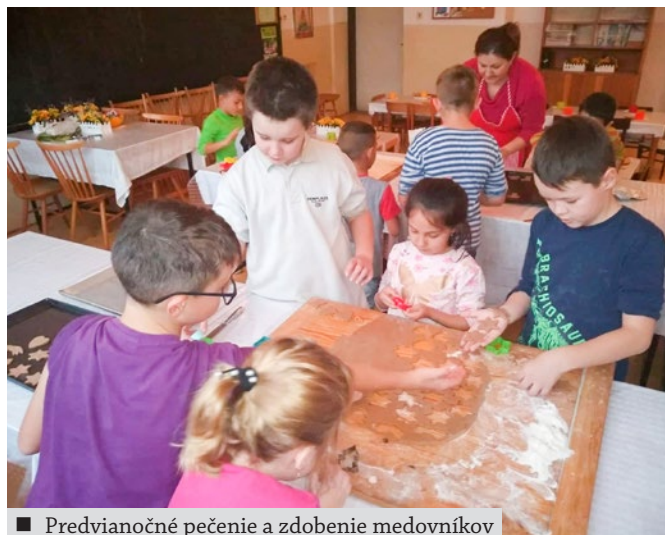
■ Predvianočné pečenie a zdobenie medovníkov

Na záver vám všetci z našej malej školičky vo Vaďovciach chceme popriať zdravie, radosť a pokoj do všetkých dní v celom tomto roku.