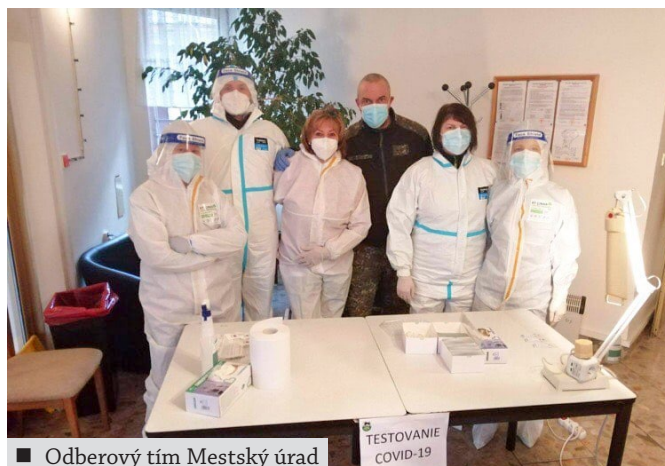
■ Odberový tím Mestský úrad

Sme radi, že celé testovanie prebehlo bezproblémovo a Staroturanci opäť ukázali, že vedia byť súdržní, ohľaduplní a zodpovední.