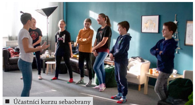
■ Účastníci kurzu sebaobranu