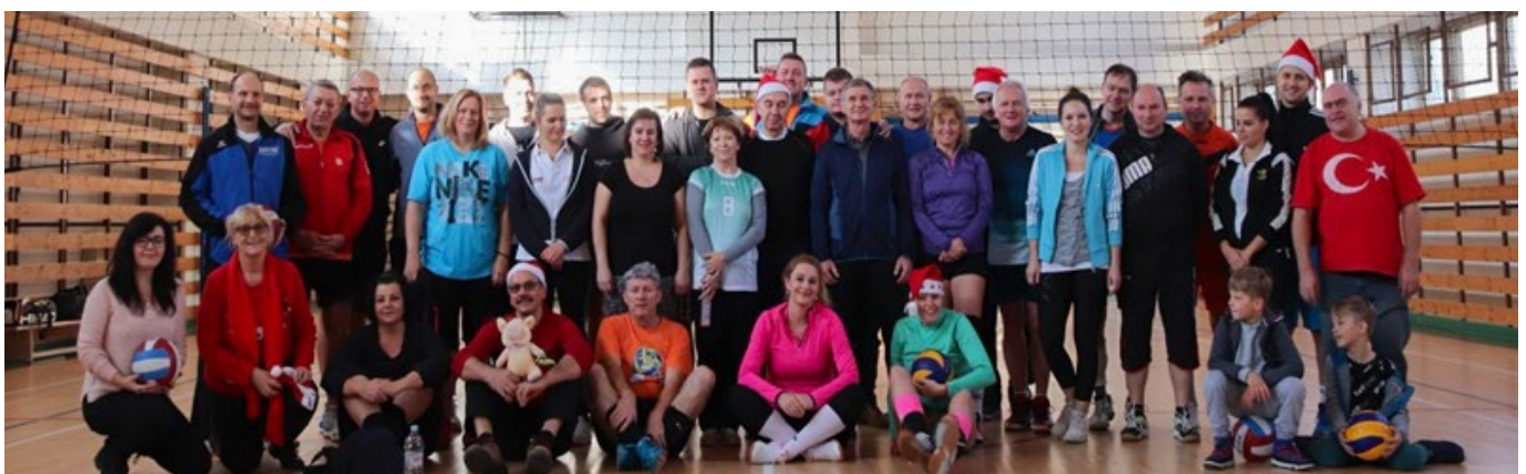
■ Všetci účastníci 14. ročníku Mikulášskeho turnaja

Sebaobrana pred negatívnymi vecami, ktoré keď pustíme do hlavy, vytesníme tie milé drobnosti, ktoré nás robia šťastnými.