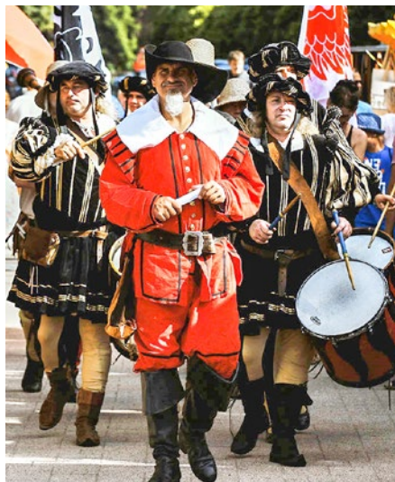
■ 350. Výročie udelenia jarmočného privilegia

(V spolupráci s Divadelným ústavom v Bratislave; autor výstavy: Karol Mišovic, grafické riešenie: Viera Burešová)