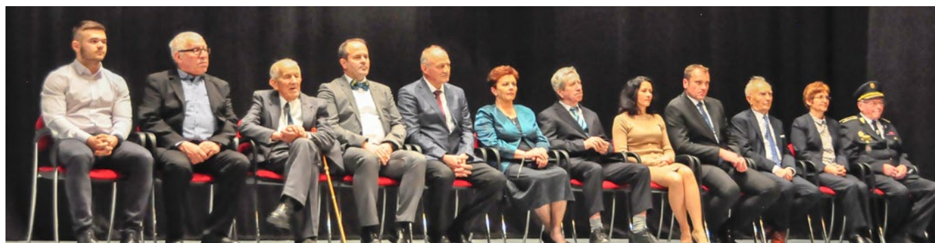
■ Na zábere všetky ocenené osobnosti

Všetkým trom srdečne blahozeláme, ďakujeme za výbornú prezentáciu mesta Stará Turá a prajeme veľa zdravia, radosti a spokojnosti.