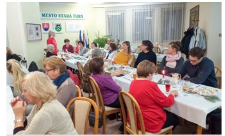
■ Záber na časť dobrovoľníkov v zasadačke MsÚ

I keď je naše mestečko malé, i v ňom sa počas celého roka realizovalo niekoľko podujatí a akcií, ktoré by sa bez prítomnosti dobrovoľníkov len ťažko uskutočnili. Či už sú to akcie spojené so seniormi, deťmi, ťažko zdravotne postihnutými občanmi, občanmi v hmotnej núdzi, rodinami – jednoducho pomoc všetkým, ktorí to potrebujú. Posedenie s malým občerstvením sa nieslo v príjemnej predvianočnej atmosfére a v prítomnosti poskytovateľov sociálnych služieb, sociálnej komisie a pozvaných dobrovoľníkov si ocenenie