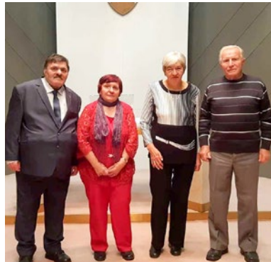
■ Manželské páry oslavujúce zlatú svadbu