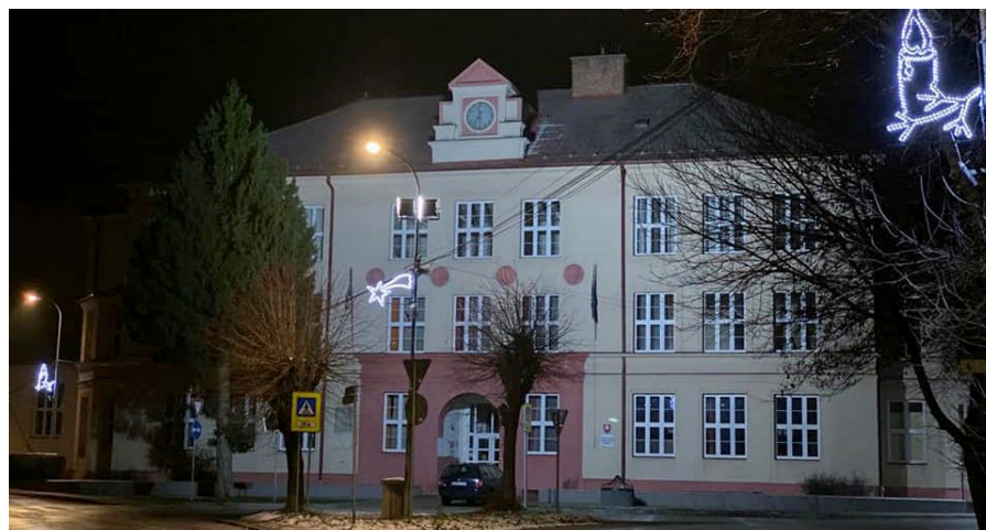
■ Bývalá Masarykova štátna meštianska škola (terajšie sídlo ZUŠ Stará Turá)

Nasvietenie dokáže zvýrazniť unikátnosť každej historickej pamiatky a okrášliť vo večerných hodinách naše mesto. Sme radi, že sa nám podarilo začiatkom decembra nasvietiť ďalšiu významnú pamiatku - bývalú Masarykovu štátnu meštiansku školu. Realizácia takéhoto osvetlenia zvýšila atraktivnosť budovy a zlepšila aj bezpečnosť pre chodcov v okolí školy. V nasvecovaní pamiatok chceme naďalej pokračovať. Veríme, že aj vďaka sponzorstvu ľudí, zatiaľ žiaľ iba z radov členov