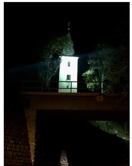
■ Stará veža na Chríbe tzv. „husitská“

nášho združenia a vďaka dobrej spolupráci s technickými službami sa nám podarí nasvietiť i ďalšie pamiatky.