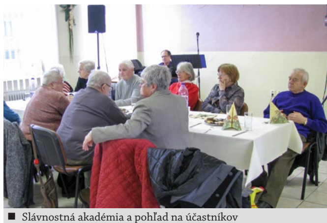
■ Slávnostná akadémia a pohľad na účastníkov

V ďalšej časti akadémie predsedníčka stručne zhrnula aktivity ZO v tomto roku. Bolo ich dosť, za ich realizáciu vďaka svojim štedrým sponzorom. Bez nich by organizácia len veľmi ťažko prežila.